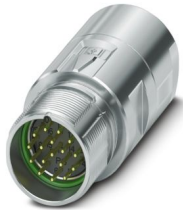
Abbildung zeigt die 17-polige Variante

Bitte beachten Sie, dass die in diesem PDF-Dokument angezeigten Daten aus unserem Online-Katalog generiert wurden. Bitte finden Sie die vollständigen Daten in der Benutzer-Dokumentation. Es gelten unsere Allgemeinen Nutzungsbedingungen für Downloads.