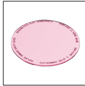
8433961 Lebensmittelfilter für Fleisch- und Wurstwaren