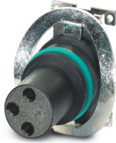
Abbildung zeigt Standardausführung

Kontaktträger, 3-polig, Buchse, gerade, M8, A-Kodierung, SMD-Reflow