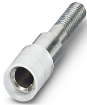
Prüfsteckerbuchse, Polzahl: 1, Farbe: weiß

Bitte beachten Sie, dass die in diesem PDF-Dokument angezeigten Daten aus unserem Online-Katalog generiert wurden. Bitte finden Sie die vollständigen Daten in der Benutzer-Dokumentation. Es gelten unsere Allgemeinen Nutzungsbedingungen für Downloads.