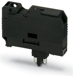
Sicherungsstecker, Nennstrom: 10 A, Sicherungstyp: G / 6,3 x 32, Farbe: schwarz

Bitte beachten Sie, dass die in diesem PDF-Dokument angezeigten Daten aus unserem Online-Katalog generiert wurden. Bitte finden Sie die vollständigen Daten in der Benutzer-Dokumentation. Es gelten unsere Allgemeinen Nutzungsbedingungen für Downloads.