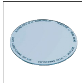
8435965 Lebensmittelfilter für Fischwaren

Um die ständige Aktualisierung unserer Produkte zu fördern, behält sich PERFORMANCE in LIGHTING das Recht vor, Änderungen ohne vorherige Ankündigung vorzunehmen. Daher wird immer empfohlen, die neueste Version zu lesen, die auf der Website www.performanceinlighting.com veröffentlicht ist. Gelieferte Lumenleistungen und Stromverbrauch, einschließlich Verluste, unterliegen einer Toleranz von +/- 7 %. Wenn nicht anders angegeben, gelten die Werte für eine Umgebungstemperatur von 25°C. Die Garantiebedingungen sind unter https://www.performanceinlighting.com/gr/company/led-warranty