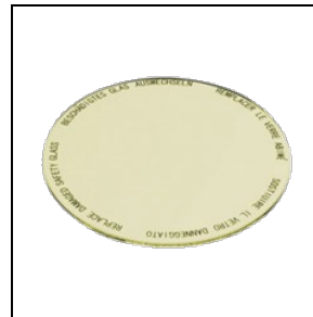
8435963 Lebensmittelfilter für Obst- und Käsewaren