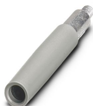
Prüfsteckerbuchse, Polzahl: 1, Farbe: grau

Bitte beachten Sie, dass die in diesem PDF-Dokument angezeigten Daten aus unserem Online-Katalog generiert wurden. Bitte finden Sie die vollständigen Daten in der Benutzer-Dokumentation. Es gelten unsere Allgemeinen Nutzungsbedingungen für Downloads.