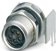
Gerätesteckverbinder Hinterwand, 5-polig, Buchse, gewinkelt, M8, B-Kodierung, Wellenlöten

Bitte beachten Sie, dass die in diesem PDF-Dokument angezeigten Daten aus unserem Online-Katalog generiert wurden. Bitte finden Sie die vollständigen Daten in der Benutzer-Dokumentation. Es gelten unsere Allgemeinen Nutzungsbedingungen für Downloads.