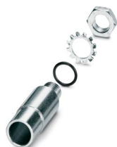
Adapter für Einlochmontage

Bitte beachten Sie, dass die in diesem PDF-Dokument angezeigten Daten aus unserem Online-Katalog generiert wurden. Bitte finden Sie die vollständigen Daten in der Benutzer-Dokumentation. Es gelten unsere Allgemeinen Nutzungsbedingungen für Downloads.