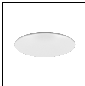
3109009 Mattierte Kunststoffscheibe (IP54) DL ROUND MIDI