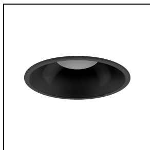
3109007 Schwarzer Reflektor DL ROUND MIDI