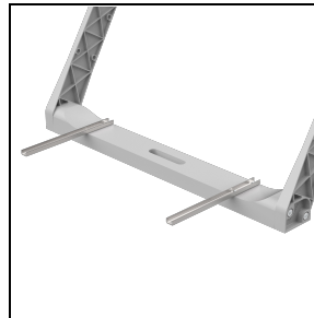
3117476 Brackets supports for driver ■ INOX / Edelstahl