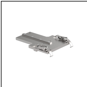
3109552 Pointer support