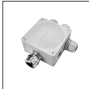
3116044 Abzweigdose Y 2-3-WEGE

Um die ständige Aktualisierung unserer Produkte zu fördern, behält sich PERFORMANCE IN LIGHTING das Recht vor, Änderungen ohne vorherige Ankündigung vorzunehmen. Daher wird immer empfohlen, die neueste Version zu lesen, die auf der Website www.performanceinlighting.com veröffentlicht ist. Gelieferte Lumenleistungen und Stromverbrauch, einschließlich Verluste, unterliegen einer Toleranz von +/- 7 %. Wenn nicht anders angegeben, gelten die Werte für eine Umgebungstemperatur von 25°C. Die Garantiebedingungen sind unter https://www.performanceinlighting.com/gr/company/led-warranty