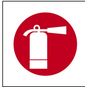
008343 Feuerlöschgerät ■ RD1 / Rot