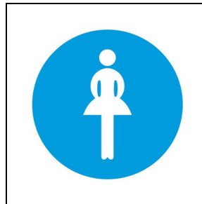
008345 Toilette Damen ■ BL1 / Blau