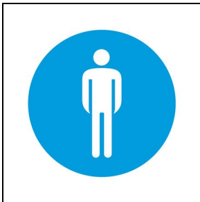
008344 Toilette Herren ■ BL1 / Blau