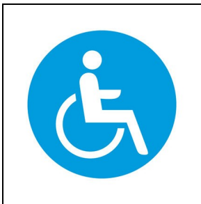
008346 Toilette für Körperbehinderte ■ BL1 / Blau