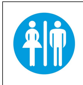
008347 Toilette ■ BL1 / Blau