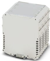
Abbildung zeigt eine bestückte Variante

Bitte beachten Sie, dass die in diesem PDF-Dokument angezeigten Daten aus unserem Online-Katalog generiert wurden. Bitte finden Sie die vollständigen Daten in der Benutzer-Dokumentation. Es gelten unsere Allgemeinen Nutzungsbedingungen für Downloads.