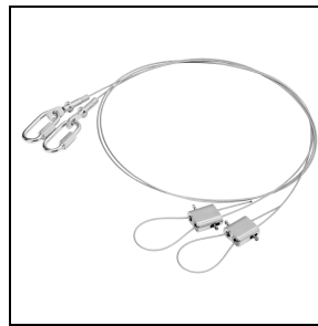
GWL1901 Seilabhangung verstellbar