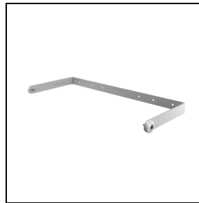
GWL1945 Flutlicht Halterungssatz 4M

Um die standige Aktualisierung unserer Produkte zu fordern, behalt sich PERFORMANCE in LIGHTING das Recht vor, anderungen ohne vorherige Ankundigung vorzunehmen. Daher wird immer empfohlen, die neueste Version zu lesen, die auf der Website www.performanceinlighting.com veroffentlicht ist. Gelieferte Lumenleistungen und Stromverbrauch, einschlielich Verluste, unterliegen einer Toleranz von +/- 7 %. Wenn nicht anders angegeben, gelten die Werte fur eine Umgebungstemperatur von 25°C. Die Garantiebedingungen sind unter https://www.performanceinlighting.com/gr/company/led-warranty