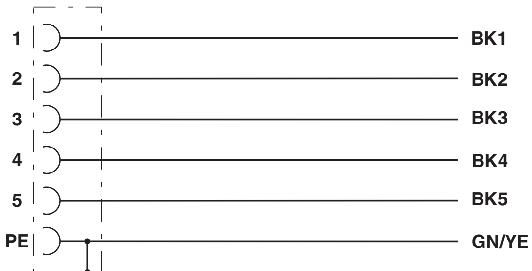
Kontaktbelegung der M12-Buchse