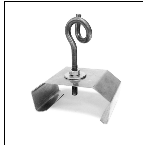
3100246 Halteungen zur Schnellmontage an der Decke aus Edelstahl + Haken (50 Stück)