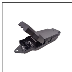
3122585 Externes Casambi Modul BK-81 / Schwarz