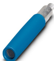
Prüfsteckerbuchse, Polzahl: 1, Farbe: blau

Bitte beachten Sie, dass die in diesem PDF-Dokument angezeigten Daten aus unserem Online-Katalog generiert wurden. Bitte finden Sie die vollständigen Daten in der Benutzer-Dokumentation. Es gelten unsere Allgemeinen Nutzungsbedingungen für Downloads.