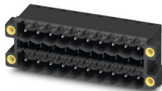
Abbildung zeigt eine 10-polige Variante mit 20 Kontakten

Leiterplatten-Grundleiste, Nennquerschnitt: 2,5 mm 2 , Farbe: schwarz, Nennstrom: 12 A, Bemessungsspannung (III/2): 320 V, Kontaktoberfläche: Sn, Kontaktart: Stift, Anzahl der Potenziale: 34, Anzahl der Reihen: 2, Polzahl: 17, Anzahl der Anschlüsse: 34, Artikelfamilie: CCDN 2,5/..-G1F-THR, Rastermaß: 5,08 mm, Montage: THR-Löten / Wellenlöten, Pin-Layout: Lineares Pinning, Pinlänge [P]: 2,6 mm, Anzahl der Lötpins pro Potenzial: 1, Stecksystem: COMBICON FKCN 2,5 – CCDN 2,5, Ausrichtung Steckgesicht: Standard, Verriegelung: Schraubverriegelung, Befestigungsart: Gewindeflansch, Verpackungsart: verpackt im Karton