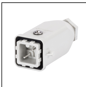
GWS3194 Männlicher Stecker 4 Polig 10 A