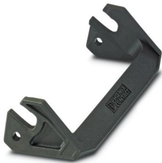
Längsbügel für B24 Gehäuse, HC-EVO....AL und HC-STA....AL

Bitte beachten Sie, dass die in diesem PDF-Dokument angezeigten Daten aus unserem Online-Katalog generiert wurden. Bitte finden Sie die vollständigen Daten in der Benutzer-Dokumentation. Es gelten unsere Allgemeinen Nutzungsbedingungen für Downloads.