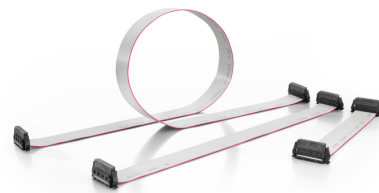
Three standard lengths (0.1 m, 0.2 m, and 0.5 m)