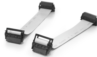
With optional strain relief