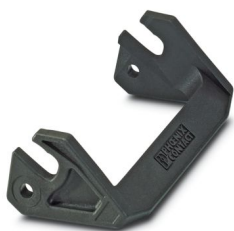
Brida longitudinal para carcasa B16, HC-EVO....AL y HC-STA....AL

Tenga en cuenta que los datos mostrados en este documento PDF se generaron a partir de nuestro catálogo online. Por favor, encontrará todos los datos en la documentación del usuario. Prevalecen nuestras condiciones generales de uso para descargas.