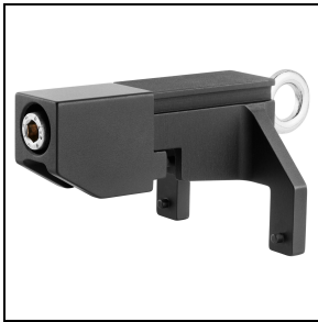
GWP30004 Halterung für Laserpointer