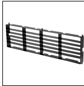
GWP30002 Blendschutzraster für rotationssymmetrische Optikversionen