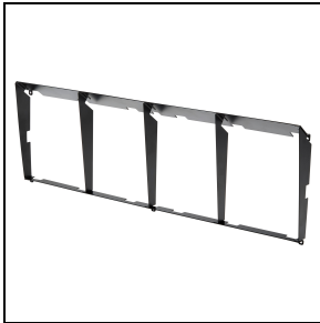
GWP30003 Blende für symmetrische oder rotationssymmetrische Optikversionen