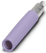
Prüfsteckerbuchse, Polzahl: 1, Farbe: violett

Bitte beachten Sie, dass die in diesem PDF-Dokument angezeigten Daten aus unserem Online-Katalog generiert wurden. Bitte finden Sie die vollständigen Daten in der Benutzer-Dokumentation. Es gelten unsere Allgemeinen Nutzungsbedingungen für Downloads.