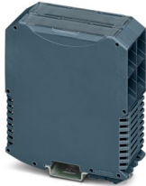
Produktfoto zeigt einen Standardartikel

Bitte beachten Sie, dass die in diesem PDF-Dokument angezeigten Daten aus unserem Online-Katalog generiert wurden. Bitte finden Sie die vollständigen Daten in der Benutzer-Dokumentation. Es gelten unsere Allgemeinen Nutzungsbedingungen für Downloads.