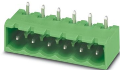
Abbildung zeigt den Standardartikel in grün

Leiterplatten-Grundleiste, Nennquerschnitt: 2,5 mm 2 , Farbe: schwarz, Nennstrom: 16 A (siehe Derating-Kurve), Bemessungsspannung (III/2): 320 V, Kontaktoberfläche: Sn, Kontaktart: Stift, Anzahl der Reihen: 1, Polzahl: 7, Artikelfamilie: MSTBA 2,5 HC/...-GU, Rastermaß: 5,08 mm, Montage: Wellenlöten, Pin-Layout: Lineares Pinning, Pinlänge [P]: 3,5 mm, Anzahl der Lötpins pro Potenzial: 1, Stecksystem: COMBICON MSTB 2,5 HC, Ausrichtung Steckgesicht: umgedreht, Verriegelung: ohne, Befestigungsart: ohne, Verpackungsart: verpackt im Karton