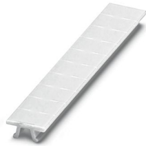
Abbildung zeigt Variante ZB 6:UNBEDRUCKT

Bitte beachten Sie, dass die in diesem PDF-Dokument angezeigten Daten aus unserem Online-Katalog generiert wurden. Bitte finden Sie die vollständigen Daten in der Benutzer-Dokumentation. Es gelten unsere Allgemeinen Nutzungsbedingungen für Downloads.