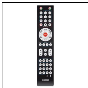
8740195967 Master Fernbedienung