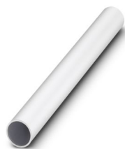
Rohr, 400 mm hoch, Ø 25 mm

Bitte beachten Sie, dass die in diesem PDF-Dokument angezeigten Daten aus unserem Online-Katalog generiert wurden. Bitte finden Sie die vollständigen Daten in der Benutzer-Dokumentation. Es gelten unsere Allgemeinen Nutzungsbedingungen für Downloads.