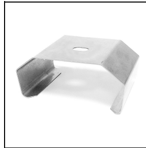
3100244 Halierungen zur Schnellmontage an der Decke aus Edelstahl (50 Stück)