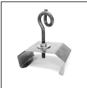
3100245 Halierungen zur Schnellmontage an der Decke aus Edelstahl + Haken (2 Stück)