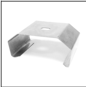
3100243 Halierungen zur Schnellmontage an der Decke aus Edelstahl (2 Stück)