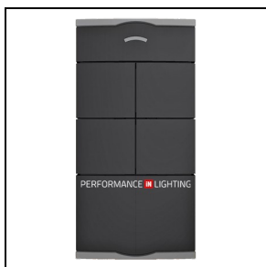
14469820 Fernbedienung mit vier konfigurierbaren Tasten