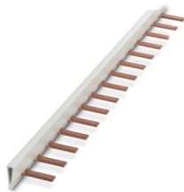
Pont d'insertion, pas: 18 mm, nombre de pôles: 56, coloris: gris

Veillez tenir compte du fait que les données affichées dans ce document PDF proviennent de notre catalogue en ligne. Vous trouverez les données complètes dans la documentation utilisateur. Nos conditions générales d'utilisation des téléchargements sont applicables.