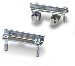
Adaptereinsatz, Bauform: D15

Bitte beachten Sie, dass die in diesem PDF-Dokument angezeigten Daten aus unserem Online-Katalog generiert wurden. Bitte finden Sie die vollständigen Daten in der Benutzer-Dokumentation. Es gelten unsere Allgemeinen Nutzungsbedingungen für Downloads.