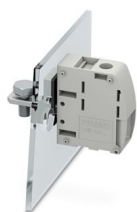
Abbildung zeigt Standardartikel

Durchführungsklemme, Anschlussart: Schraubanschluss mit Zughülse, Kabelschuhanschluss, Polzahl: 1, Belastungsstrom: 150 A, Anschlussrichtung des Leiters zur Steckrichtung: 0 °, Breite: 18,8 mm, Farbe: grau