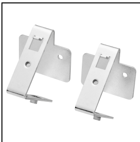
GWS3191 Wandmontagehalterung 30°/45°