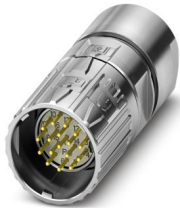
Abbildung zeigt die 17-polige Variante

Bitte beachten Sie, dass die in diesem PDF-Dokument angezeigten Daten aus unserem Online-Katalog generiert wurden. Bitte finden Sie die vollständigen Daten in der Benutzer-Dokumentation. Es gelten unsere Allgemeinen Nutzungsbedingungen für Downloads.