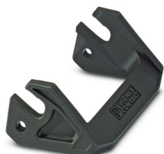
Brida longitudinal para carcasa B10, HC-EVO....AL y HC-STA....AL

Tenga en cuenta que los datos mostrados en este documento PDF se generaron a partir de nuestro catálogo online. Por favor, encontrará todos los datos en la documentación del usuario. Prevalecen nuestras condiciones generales de uso para descargas.