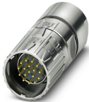
Abbildung zeigt die 17-polige Variante

Bitte beachten Sie, dass die in diesem PDF-Dokument angezeigten Daten aus unserem Online-Katalog generiert wurden. Bitte finden Sie die vollständigen Daten in der Benutzer-Dokumentation. Es gelten unsere Allgemeinen Nutzungsbedingungen für Downloads.