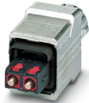
Connecteur mâle SCRJ Push-Pull, IP67

Veillez tenir compte du fait que les données affichées dans ce document PDF proviennent de notre catalogue en ligne. Vous trouverez les données complètes dans la documentation utilisateur. Nos conditions générales d'utilisation des téléchargements sont applicables.