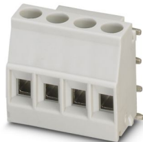
Abbildung zeigt Standardartikel

Leiterplattenklemme, Nennstrom: 24 A, Bemessungsspannung (III/2): 400 V, Nennquerschnitt: 2,5 mm 2 , Anzahl der Potenziale: 4, Anzahl der Reihen: 1, Polzahl pro Reihe: 4, Artikelfamilie: MKDSO 2,5/..-R, Rastermaß: 5 mm, Anschlussart: Schraubanschluss mit Zughülse, Montage: Wellenlöten, Anschlussrichtung Leiter/Platine: 0 °, Farbe: lichtgrau, Pin-Layout: Lineares Pinning, Pinlänge [P]: 3,5 mm, Anzahl der Lötpins pro Potenzial: 1, Verpackungsart: verpackt im Karton. Bedruckte Variante, Artikel mit seitlichem Pinabgang rechts