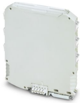
Abbildung zeigt eine bestückte Variante

Bitte beachten Sie, dass die in diesem PDF-Dokument angezeigten Daten aus unserem Online-Katalog generiert wurden. Bitte finden Sie die vollständigen Daten in der Benutzer-Dokumentation. Es gelten unsere Allgemeinen Nutzungsbedingungen für Downloads.