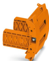
Blindstecker, Polzahl: 4, Farbe: orange

Bitte beachten Sie, dass die in diesem PDF-Dokument angezeigten Daten aus unserem Online-Katalog generiert wurden. Bitte finden Sie die vollständigen Daten in der Benutzer-Dokumentation. Es gelten unsere Allgemeinen Nutzungsbedingungen für Downloads.