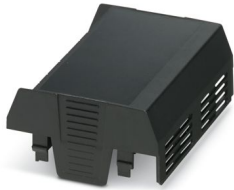
Produktfoto zeigt einen Standardartikel

Bitte beachten Sie, dass die in diesem PDF-Dokument angezeigten Daten aus unserem Online-Katalog generiert wurden. Bitte finden Sie die vollständigen Daten in der Benutzer-Dokumentation. Es gelten unsere Allgemeinen Nutzungsbedingungen für Downloads.