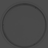
MULTI+ 40 PC