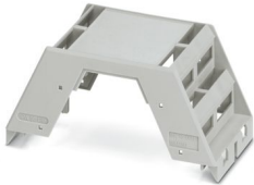
Abbildung zeigt einen Standardartikel

Tragschienegehäuse, Gehäuseoberteil für Leiterplattenklemmen mit Schraubanschluss, Breite: 45,2 mm, Höhe: 99 mm, Tiefe: 45,85 mm, Farbe: lichtgrau (ähnlich RAL 7035)