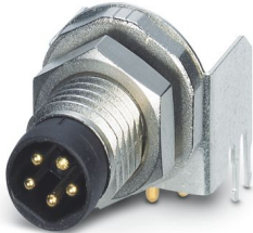
Gerätesteckverbinder Hinterwand, 5-polig, Stift, gewinkelt, M8, B-Kodierung, Wellenlöten

Bitte beachten Sie, dass die in diesem PDF-Dokument angezeigten Daten aus unserem Online-Katalog generiert wurden. Bitte finden Sie die vollständigen Daten in der Benutzer-Dokumentation. Es gelten unsere Allgemeinen Nutzungsbedingungen für Downloads.