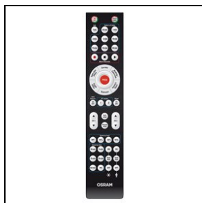
8740195967 Master Fernbedienung