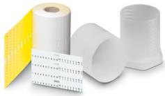
Abbildung zeigt den Artikel TMT 4 R YE

Marker für Klemmen, Rolle, bestellbar: zeilenweise, weiß (RAL 9010), beschriftet nach Kundenangaben, perforiert, Montageart: verrasten, für Klemmenbreite: 4,2 mm, Anzahl der Einzelschilder: 24000, Textfeldhöhe: 4,15 mm, Textfeldbreite: 6,35 mm